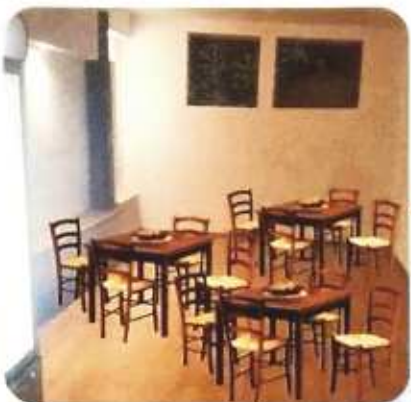
SALA INTERNA CLIMATIZZATA